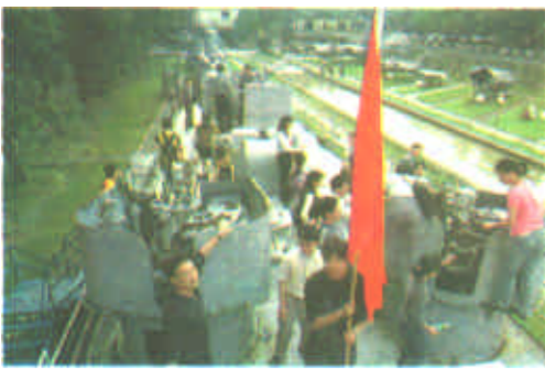
海军黄浦军事博览中心日前推出军事旅游项目，寓国防教育于游乐之中，使游客在参观中学到国防知识。这是游客在军舰上参观游览。