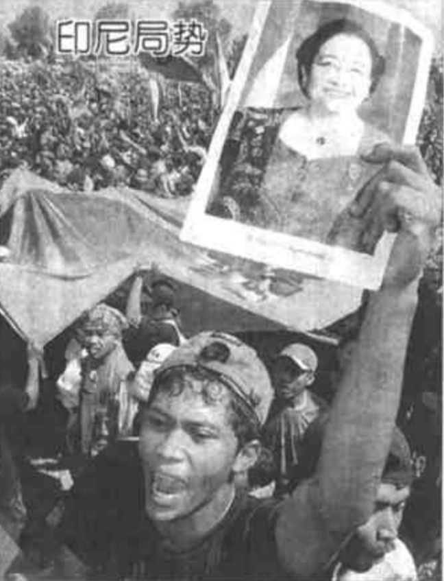
5月20日,印尼民主斗争党的一名支持者在瓜哇岛东部玛琅市的集会上高举该党主席、印尼现任副总统梅加瓦蒂·苏加诺的大幅照片。梅加瓦蒂当天表示,她自己并没有政治野心,但愿顺应本党的意愿出任总统。

紫外线只要能射到地面,就会反射到人和皮肤上,它们是紫外线的靶器官。如果不注意保护眼睛,紫外线对眼睛的损伤将可能导致一系列后果。 配戴合适的太阳镜是防紫外线的最有效方法。现在市场上太阳镜从镜片颜色到款式种类繁多。据专业人士介绍,选配太阳镜最好选灰色镜片,灰色是中性,它能将赤橙黄绿青蓝紫七色比例减弱,戴上后有阴天的感觉。其次是绿色、褐色、茶绿色、茶色等。太阳镜颜色不宜太深,否则会使瞳孔散大,射入的紫外线会更多,过红或过蓝的镜片对眼睛都没有好处。除了颜色上的选择外,目前太阳镜分为吸收式和反射式两大类。吸收式太阳镜是在玻璃里加上某些重金属氧化物,这种镜片可以选择地把某些有害光滤除掉。而反射式镜片是根据光线反射性能而在镜片镀膜,将有光反射出去,保护眼球不受伤害。 出外旅游,太阳镜更是必需品,因为太阳光照在沙滩、海洋、雪地、水泥公路上或强烈的光源反射的紫外线,需要太阳镜将其吸收或反射,否则,强光不仅使人眩目,严重者还可引起视力下降和眼球组织(如角膜、晶体和视网膜等)受损。